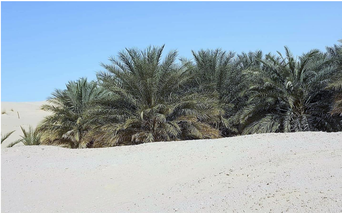
Oasis de Oued Souf