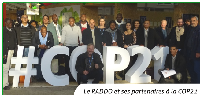
Le RADDO et ses partenaires à la COP21

L'année 2015 aura vu l'émergence de nouvelles initiatives multi-acteurs rappelant ainsi que les oasis ne sont pas uniquement l'affaire des oasiens, mais bien de tous. C'est d'ailleurs ce "nous" imposé par les différentes projections sociales, économiques ou encore environnementales, qui s'est un peu plus exprimé à travers les 195 gouvernements ayant participé à la COP12 à Ankara et à la COP21 à Paris, où le RADDO était présent. Dors et déjà, les oasis suscitent un