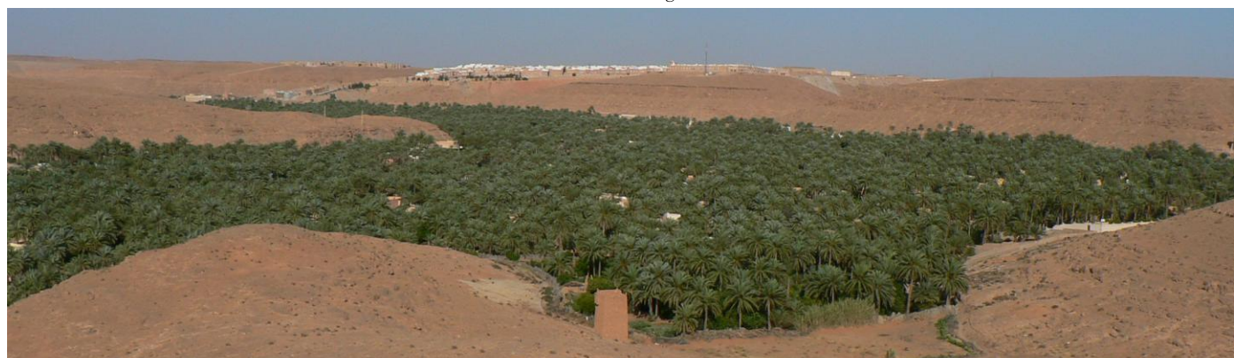
Oasis de Beni Isguen

Les associations partenaires ( ASPG, GTDPO, AEDD ) contribuent à la mobilisation des acteurs.