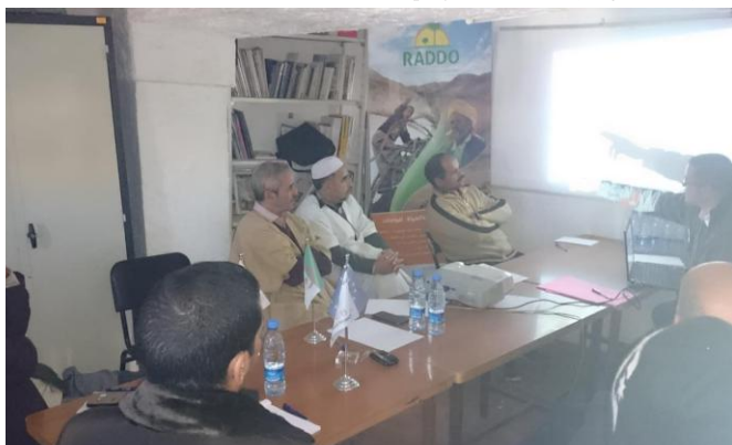
Rencontre annuelle sur l'état d'avance du projet DevOasis (siège APEB)

La rencontre était aussi l'occasion d'échanger sur les fonds de soutien aux initiatives oasiennes prévues dans le cadre du projet. Cette rencontre assurera une implication continue des acteurs du projet.