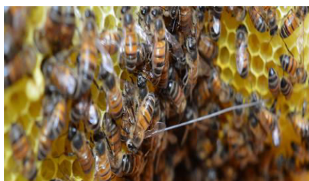
Abeille Saharienne (Djebel Morgnaa)

Longévité : Varie de 13 jours pour l'ouvrière des fois jusqu'à 3 ans pour la reine.